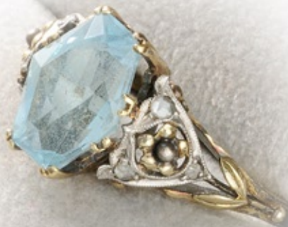
1930年のアクアマリン