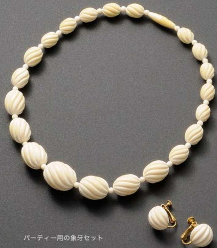
パーティー用の象牙セット