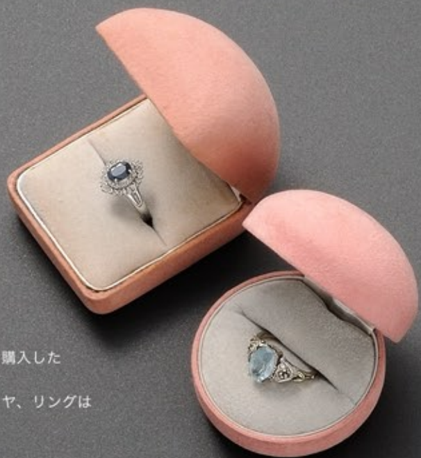
松屋銀座で購入した サファイヤ 周囲はダイヤ、リングは プラチナ