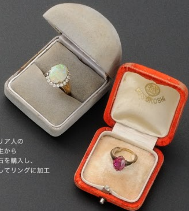
オーストラリア人の 英会話の先生から オパールの石を購入し、 友人に依頼してリングに加工