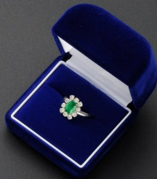
東京会館で購入したピエールカルダンのエメラルド