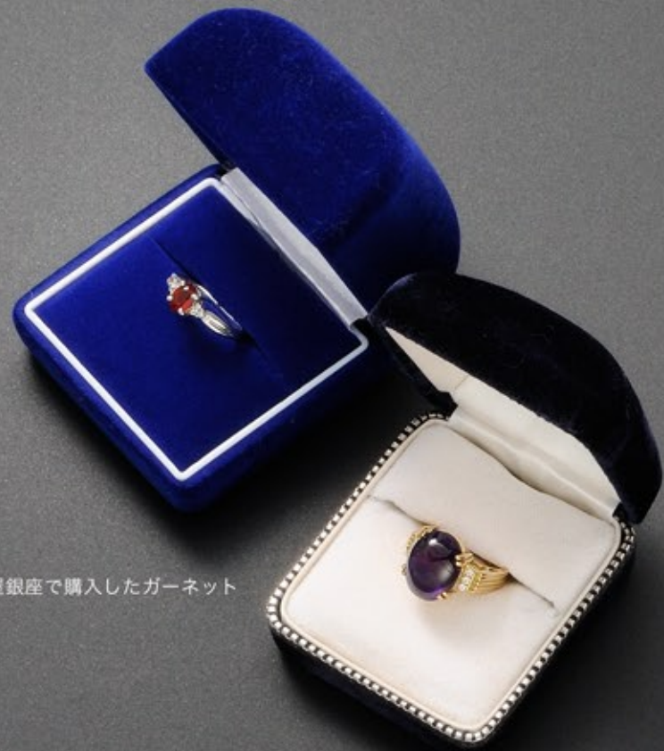
松屋銀座で購入したガーネット