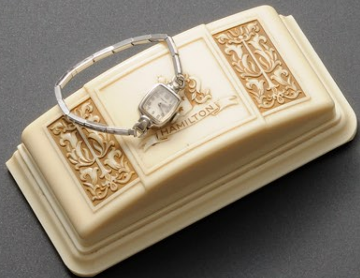
結婚指輪に代わる結婚記念