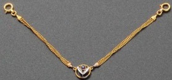
父から母へ贈られたヨーロッパ土産の羽織紐