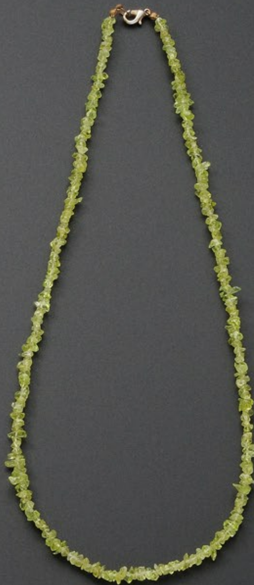
息子夫婦のハワイ土産