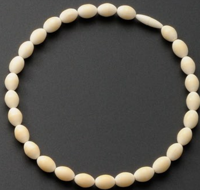
着用しやすい象牙