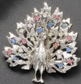
東京会館の友人からのプレゼント