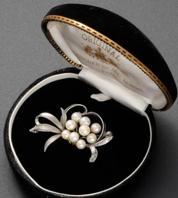
フォーマルスーツ用