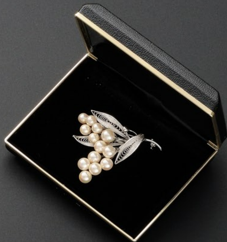
フォーマルスーツ用