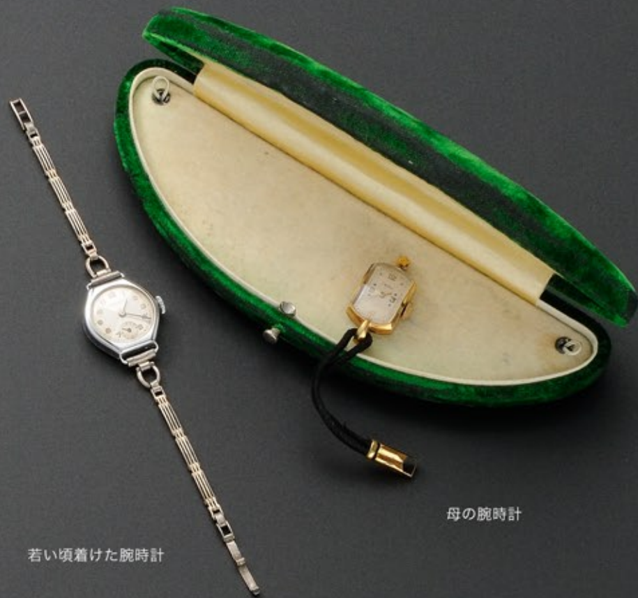
若い頃着けた腕時計