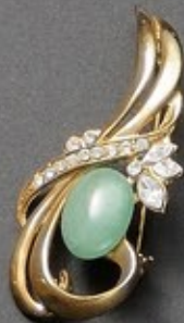
横浜で購入したネックレスとのペア